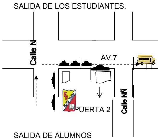
Figura 1. Croquis Salida de Alumnos

La Salida de todos los y las estudiantes será por la puerta grande, ubicada en cancha. Habrá un rayado amarillo (Ruta Vehicular); donde circularan los autos que vienen a buscar a los y las estudiantes. (Carros que este fuera de esa ruta no se le entregaran a los y las estudiantes). Los carros que vienen del sentido contrario de la vía tampoco serán entregado los y las estudiantes. Representantes que vienen a buscar a los y las estudiantes de forma peatonal tomar las siguientes precauciones: