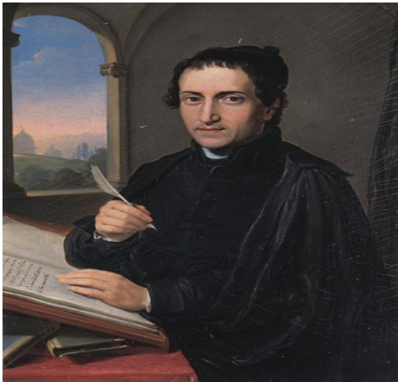
BEATO ANTONIO ROSMINI (1797-1855)